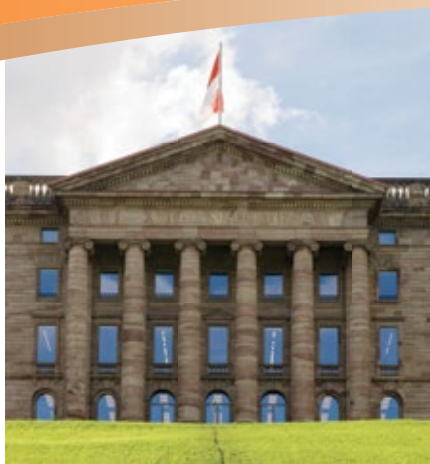
Museum Schloss Wilhelmshöhe

Baroque palace in Karlsaue Park; Cabinet of Astronomy and Physics with Planetarium; Open: Tues – Sun 10 am – 5 pm